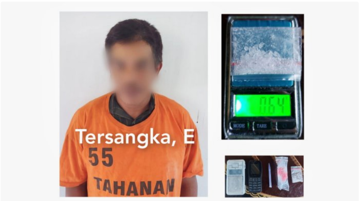
Keterangan Photo ; Tersangka E Berikut Barbuk Miliknya

SIMALUNGUN- Tim Opsnal Satuan Reserse Narkoba Polres Simalungun meringkus seorang pelaku peredaran narkotika jenis sabu berinisial E (42) berikut sejumlah barang bukti miliknya dalam satu penggerebekan di kediaman pelaku.